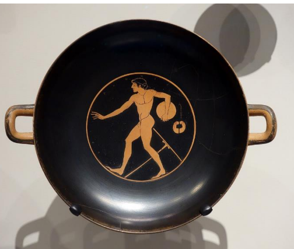
Vrhač disku, detail vázy cca z roku 500 př. n. l.