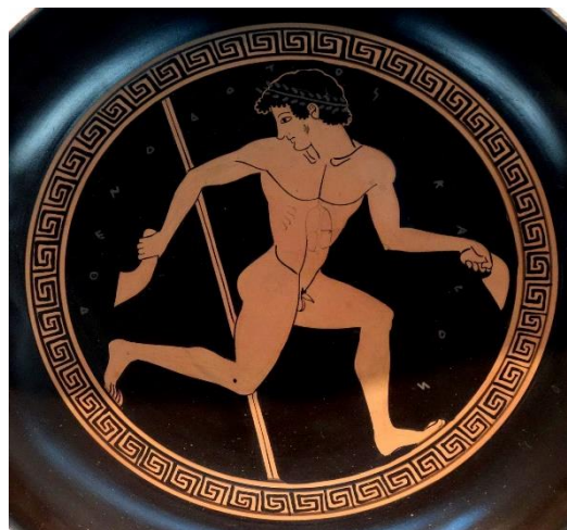
Mladík nesoucí závaží pro skok do dálky (halteres), detail vázy z konce 6. stol. př. n. l., Zdroj: Wikimedia Commons