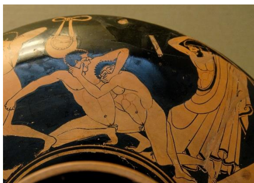
Bojové umění pankráción: zápasník vpravo se snaží vydolbnout oko svému protivníkovi. Rozhodčí se ho za tento faul chystá udeřit. Detail číše, 490–480 př. n. l