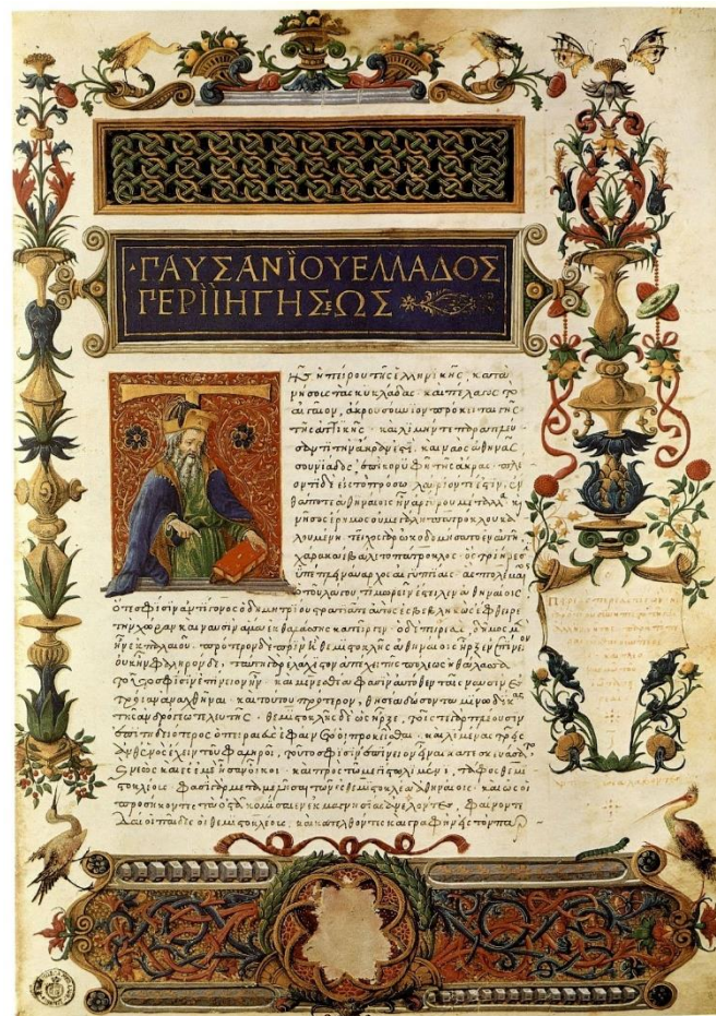
Úvodní stránka Pausaniova cestopisu v renesančním rukopisu z roku 1485.

Zdroj: Pausanias, Cesta po Řecku. Překlad Helena Businská 1973–1974, s. 379–380. Původní text vznikl přibližně ve 2. stol. n.l.